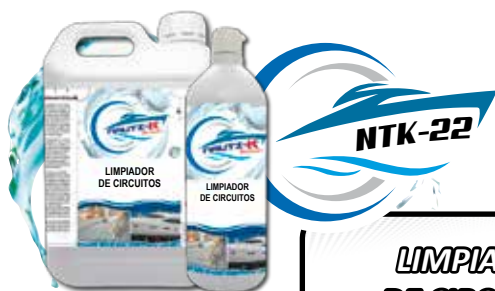
NTK-22 LIMPIADOR DE CIRCUITOS