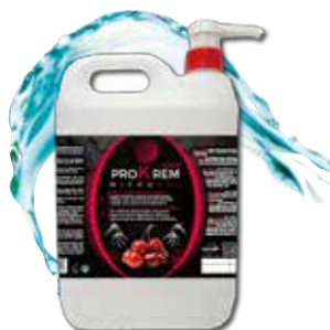
PROKREM Crema lavamanos para mecánico